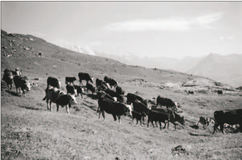
Troupeau en alpage

Alors ? Que croyez-vous qu'il arrivât ? Que fit Raoul... ? Vous le saurez en lisant la suite de cette véridique histoire à la page 43 du nouveau Vatusium !